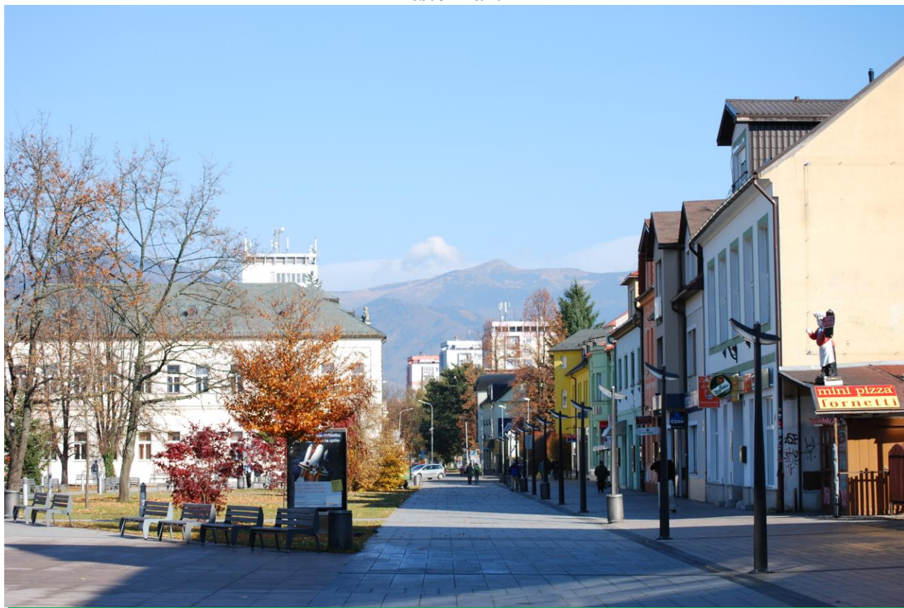
Malý Fatranský Kriváň/1671 mnm./ v pozadí Martinskej pešej zóny